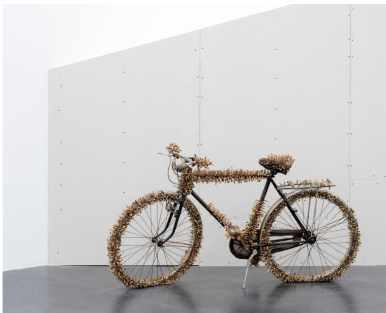
Ingeborg Lüscher, Stummelobject , Bicyclette, 1969